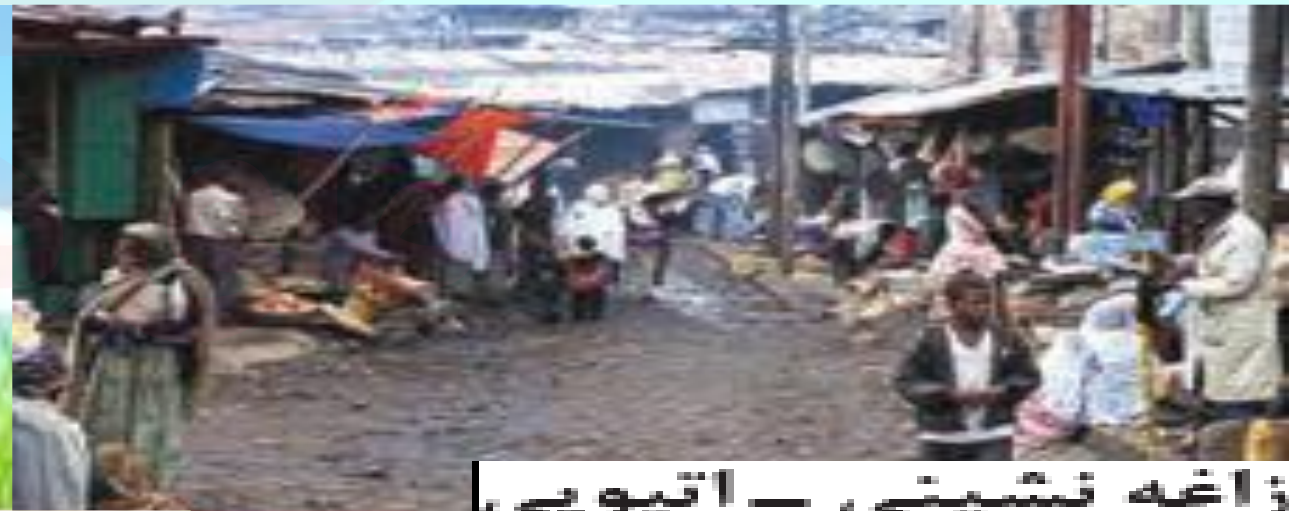
زاغه نشینی - اتیوپی