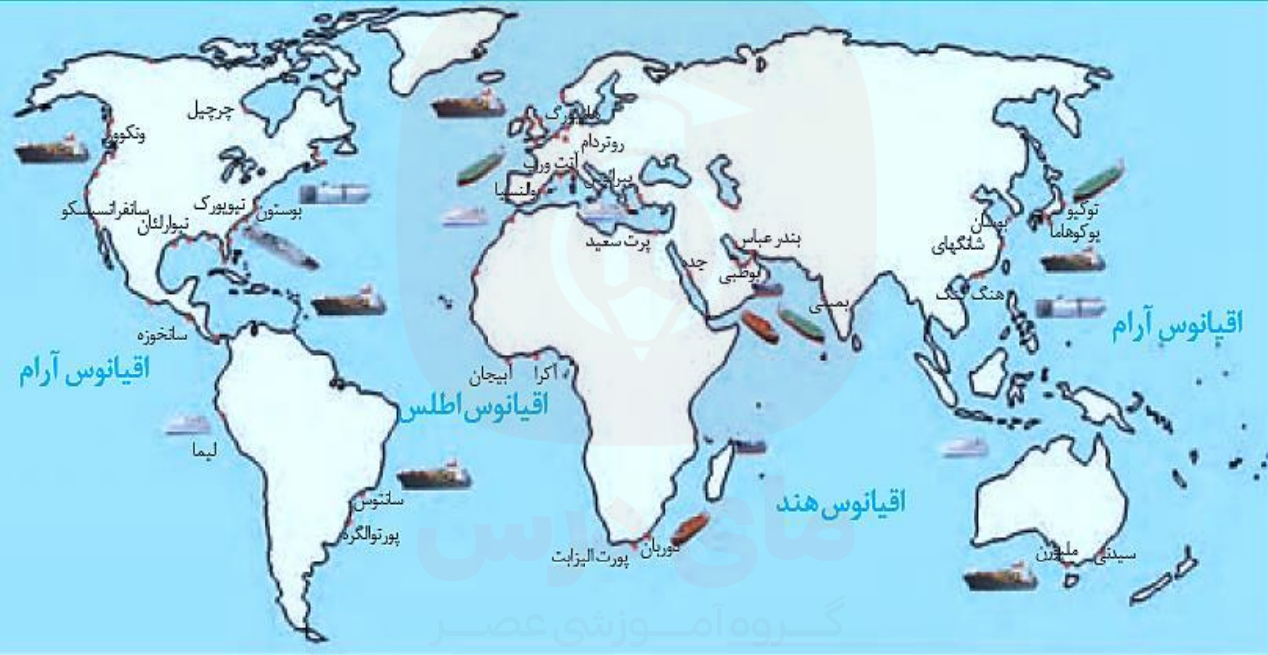
برخی از مهم ترین بنادر جهان