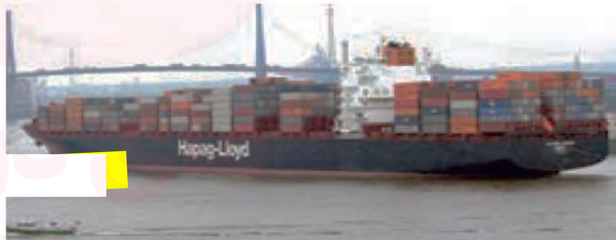
یک کشتی بزرگ کانتینری - آلمان