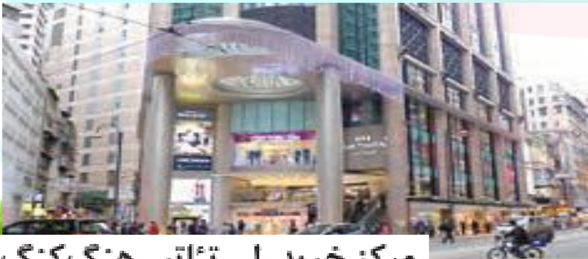
مرکز خرید لی تئاتر - هنگ کنگ

ناحیه هایی پدید می آیند که از نظر امکانات و تسهیلات و چشم اندازهای جغرافیایی با یکدیگر تفاوت دارند.