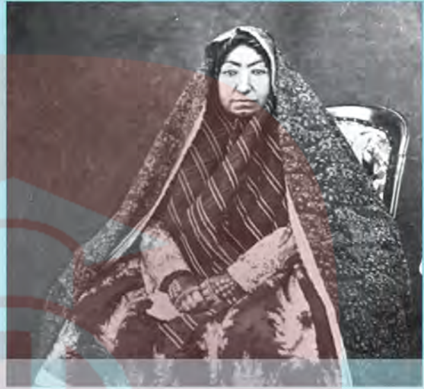
مهدعلیا (۱۲۲۰-۱۲۹۰ق)، مادر ناصرالدین شاه، از زنان بانفوذ دربار قاجار