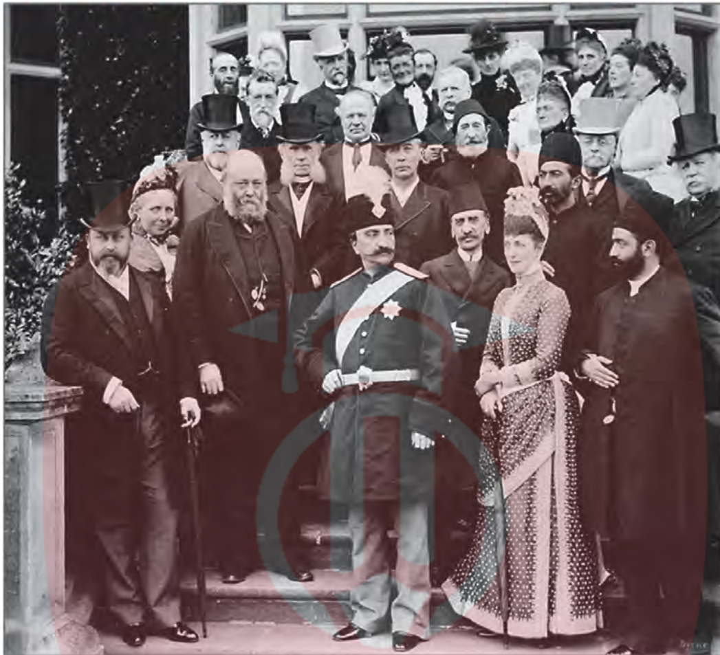
ناصرالدین شاه در سفر سوم به فرنگ - انگلستان، قصر هانتفیلد ۱۳۰۶ ق/ ۱۸۸۹ م

2. چرا برنامه های میرزا حسین خان سپهسالار به نتیجه نهایی نرسید؟