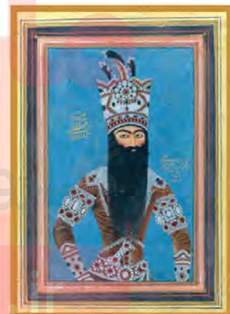
نگاره فتحعلی شاه (۱۱۸۶-۱۲۵۰ ق) - اثر مهرعلی نقاش