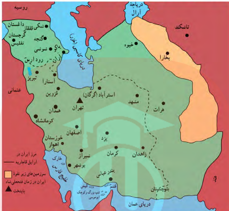
قلمرو حکومت قاجار در زمان فتحعلی شاه