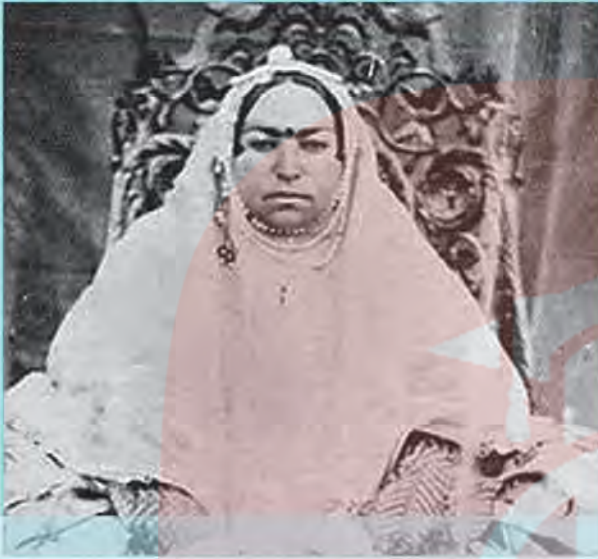
ملک نساء خانم عزت الدوله، خواهر ناصرالدین شاه و همسر امیر کبیر