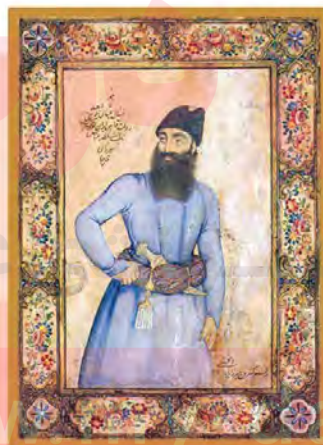
نگاره عباس میرزا (۱۲۰۳-۱۲۴۹ ق) - اثر میرزا بابا نقاش