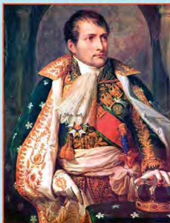
ناپلئون بناپارت، امپراتور فرانسه