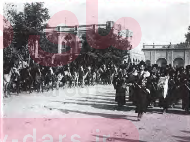
رژه نیروهای قزاق

5. ناصرالدین شاه امتیاز تاسیس بریگاد قزاق را به کدام کشور واگذار کرد و وظیفه آنها چه بود؟