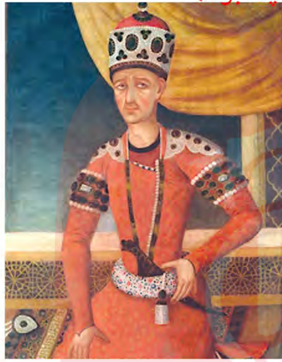
نگاره آقا محمدخان قاجار (۱۱۵۵-۱۲۱۱ق)