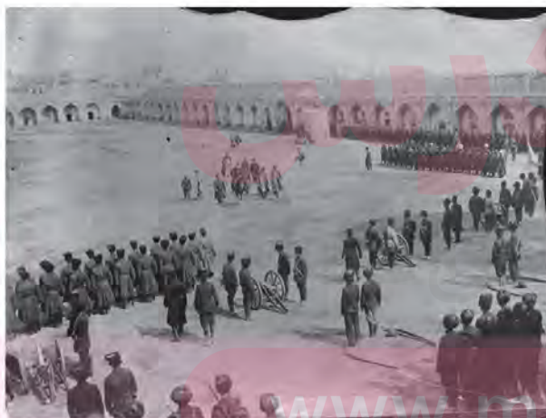
رژه واحدهای نظامی در میدان مشق - تهران

4. یکی از مقاصد امیر کبیر از تاسیس مدرسه دارالفنون چه بود؟