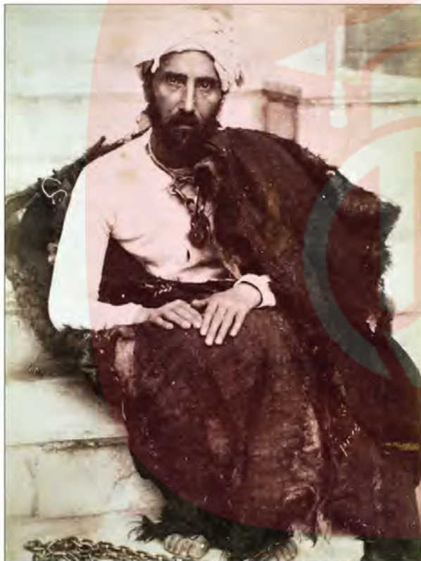
میرزا رضا کرمانی (۱۲۲۶-۱۲۷۵ ش)

4. ویژگی‌های نظام پادشاهی مطلقه و استبدادی را نام ببرید