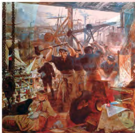
تابلوی آهن و زغال سنگ، اثر ویلیام بل اسکات، نقاش اسکاتلندی - اواسط سده ۱۹م

4- انقلاب صنعتی، دگرگونی جهان؛ تا اواخر قرن ۱۸م عامل اصلی تولید نیروی بازوی انسان بود. صنعتگران برای تولید کالای بیشتر، مهارت های فکری، جسمی و هنری خود را به کار می بستند و از دیگر نیروهای طبیعت، مانند آب و باد، کمتر استفاده می کردند. در انقلاب صنعتی نیروی محرکه آب و سپس بخار جایگزین نیروی جسمی انسان شد. (این انقلاب با اختراع و تکمیل ماشین بخار در انگلستان آغاز گردید) اگر چه (سرازیر شدن ثروت افسانه ای سرزمین های استعمار شده ای مانند هند و آمریکا (قبل از قرن ۱۸) و همچنین نظام گسترده برده داری و تجارت پرسود آن نیز، به شکل گیری انقلاب صنعتی کمک کرد.)