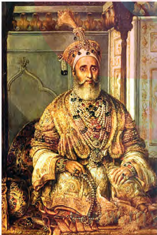
بهادرشاه دوم، آخرین فرمانروای گورکانی هند (۱۸۳۷-۱۸۵۷م) که کمپانی هند شرقی انگلستان او را از قدرت برکنار و به برمه تبعید کرد.

۷. انگلیسی‌ها برای حفظ سلطه خودشان در هندوستان چه اقداماتی انجام دادند؟