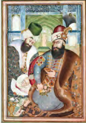
نگاره کریم خان زند هنگام دیدار با فرستاده عثمانی

2. برخی از خصوصیات اخلاقی کریم خان زند که از او نام و نشانی نیک در تاریخ به جا گذاشت را نام ببرید.