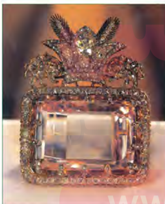
الماس دریای نور - موزه جواهرات ملی ایران