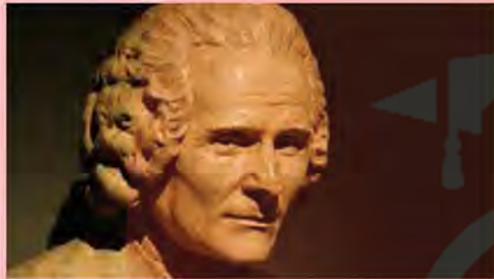
نگاره ژان ژاک روسو (۱۷۱۲-۱۷۷۸م)

در کنار این عوامل، تحولات فکری جامعه فرانسه نیز نقش بزرگی در پیدایش انقلاب داشت. در این کشور تحت تأثیر عصر روشنگری اروپا، فلاسفه و روشنفکرانی ظهور کردند که اندیشه‌های آنان مردم را به سوی انقلاب رهنمون ساخت. گروهی از این روشنفکران که به اصحاب دایره المعارف شهرت داشتند، با طرح مباحث علمی و ادبی شروع به انتقاد از وضع موجود کردند. (ولتر، مونتسکیو و روسو سه تن از مشهورترین روشنفکران فرانسه در این دوره بودند. ولتر از اطاعت انسان از عقل مادی و مبارزه با خرافات سخن می‌گفت. مونتسکیو از تفکیک قوای سیاسی و حقوق بشر دفاع می‌کرد. روسو نیز بر اهمیت انتخابات تأکید می‌کرد و تشکیل حکومت را حاصل قراردادی اجتماعی می‌دانست.) این‌گونه نظریات دیدگاه مردم فرانسه را تغییر داد. (غفلت لویی شانزدهم از احوال مردم از یک سو و تجملات و ولخرجی‌های او و درباریان از سوی دیگر آتش خشم مردم را شعله‌ور ساخت.)