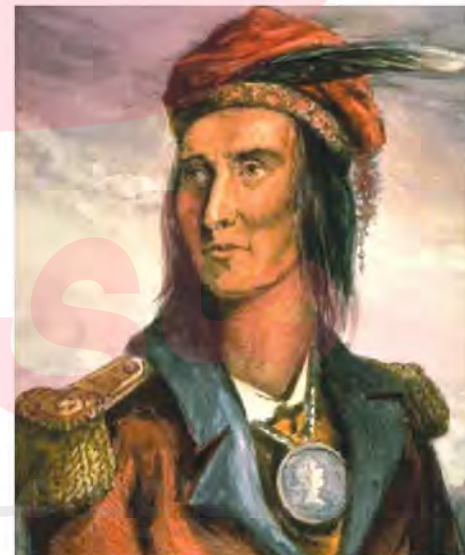
نگاره تکومسه (Tecumseh)، رهبر جنگجوی قبایل سرخ پوست که در برابر پیشروی سربازان آمریکایی مقاومت بسیاری کرد (اوایل قرن ۱۹م).

در ژوئیه ۱۷۷۶م مستعمره نشینان که برای کسب استقلال با انگلستان می جنگیدند، اعلامیه استقلال ایالات متحده را صادر کردند. در مقدمه این اعلامیه آمده است: «ما این حقایق را بدیهی می انگاریم که همه انسان ها برابر آفریده شده اند و آفریدگارشان حقوق سلب نشدنی معینی به آنها اعطا کرده است که حق زندگی، آزادی و جست و جوی خوشبختی از جمله آنهاست...». با بررسی رفتار غیرانسانی سفیدپوستان آمریکا در قتل چند میلیون سرخ پوست که ساکنان اصلی آن سرزمین بودند و نیز بردگان سیاه پوست آفریقایی، میزان پایبندی آمریکا به اعلامیه استقلال را تجزیه و تحلیل کنید.