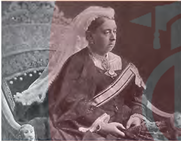
ملکه ویکتوریا (۱۸۱۹-۱۹۰۱ م)

کشورهای اروپایی در سده‌های پس از عصر رنسانس شاهد انقلاب‌های سیاسی بزرگی بودند که به تغییرات سیاسی و اجتماعی عمیق و بنیادینی در این کشورها منجر شد (ظهور انقلاب صنعتی نیز تحولات مهمی در پی داشت که شتاب گرفتن و گسترش استعمار ۲ از جمله آنها بود.) ۱