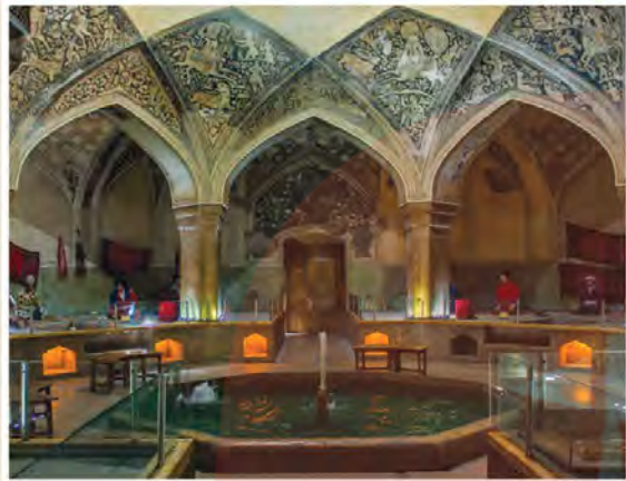
حمام وکیل - شیراز

کریم خان زند علاقه زیادی به ساختن بناهای باشکوه داشت. ساخت مجموعه مسجد و بازار و حمام وکیل، ارگ کریم خانی و بازسازی آرامگاه حافظ، سعدی و باغ دلگشا، گوشه‌ای از اقدامات عمرانی او در شیراز است. در دوره زند نوعی از بناها با کاربرد تفریحی گسترش یافت که به کلاه فرنگی معروف بود و آن بنایی کوچک و گاهی تزئینی بود که در وسط باغ‌ها یا تفریحگاه‌ها ساخته می‌شد (3). 1) در نقاشی و نگارگری، به ویژه در عصر کریم خان زند، تحولی بزرگ به وجود آمد و نقاشان به تدریج هنر خود را با معیارهای هنری اروپا تطبیق دادند. مکتب نقاشی شیراز که در دوره مغولان شکل گرفته بود، در زمان زندیه به اوج رونق و زیبایی رسید و نقاشان برجسته‌ای مانند محمدصادق، اشرف و میرزا بابا آثار زیبایی آفریدند. (1)