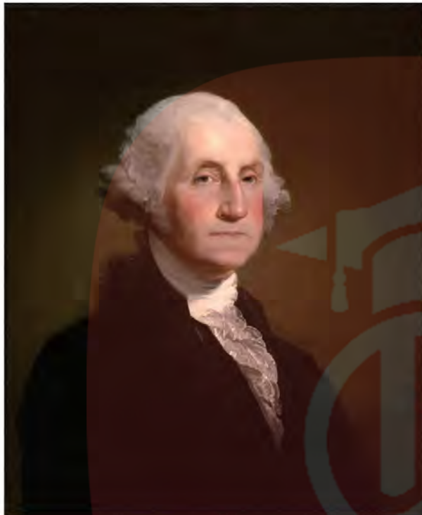
نگاره جورج واشینگتن (۱۷۲۲-۱۷۹۹ م)

استقلال آمریکا به پایان رسید (۱۷۸۳م) و جورج واشینگتن ۱ به عنوان نخستین رئیس جمهور این کشور انتخاب شد (۱۷۸۹م) ۴ دولت آمریکا پس از استقلال این کشور با پیشروی به سوی غرب و کشتار وسیع سرخ پوستان که ساکنان و صاحبان صدها ساله اصلی آمریکا بودند، سرزمین های وسیعی را تصاحب کرد. در جنوب هم، با اشغال سرزمین پهناوری از مکزیک، بزرگ ترین ایالت های جنوبی و جنوب غربی مانند کالیفرنیا و تگزاس را به ایالات خود افزود. ۲ (این دولت همچنین با بهره گیری از نیروی کار بردگان آفریقایی اقتصاد خود را توسعه بخشید و در پایان سده ۱۹م به پیشرفت های وسیع سیاسی، اقتصادی و صنعتی دست یافت و به رقیبی برای کشورهای استعمارگر اروپایی تبدیل شد.) ۳