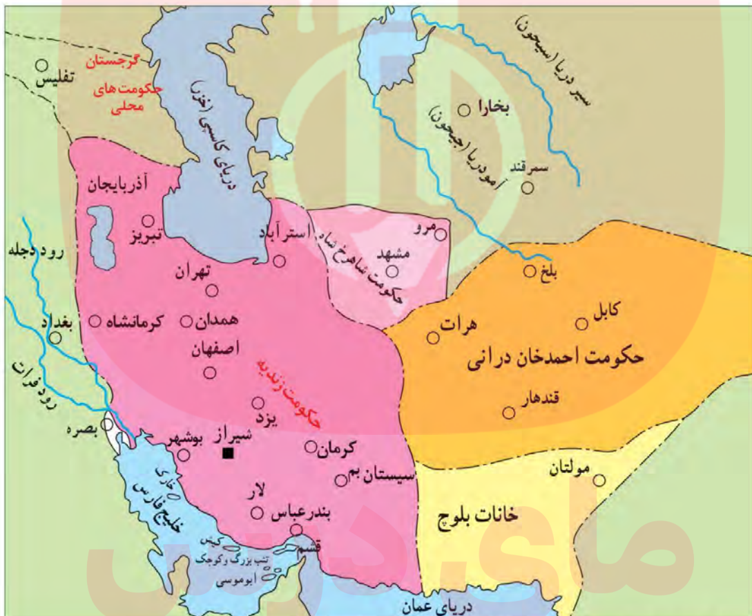
نقشه ایران در دوران زندیه

کریم خان، برخلاف سنت معمول، از پذیرفتن عنوان شاه امتناع کرد و خود را وکیل مردم ایران (وکیل الرعایا) ۱ خواند (بعضی از خصوصیات اخلاقی کریم خان مانند مدارا با دشمنان، همدردی با مردم، ساده‌زیستی و رفتار مناسب با اقلیت‌های دینی و مذهبی باعث شده است که نام و نشان نیکی از او در تاریخ ایران به جا بماند. 2 )