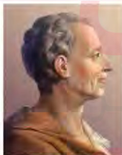
نگاره مونتسکیو (۱۶۸۹-۱۷۵۵م)