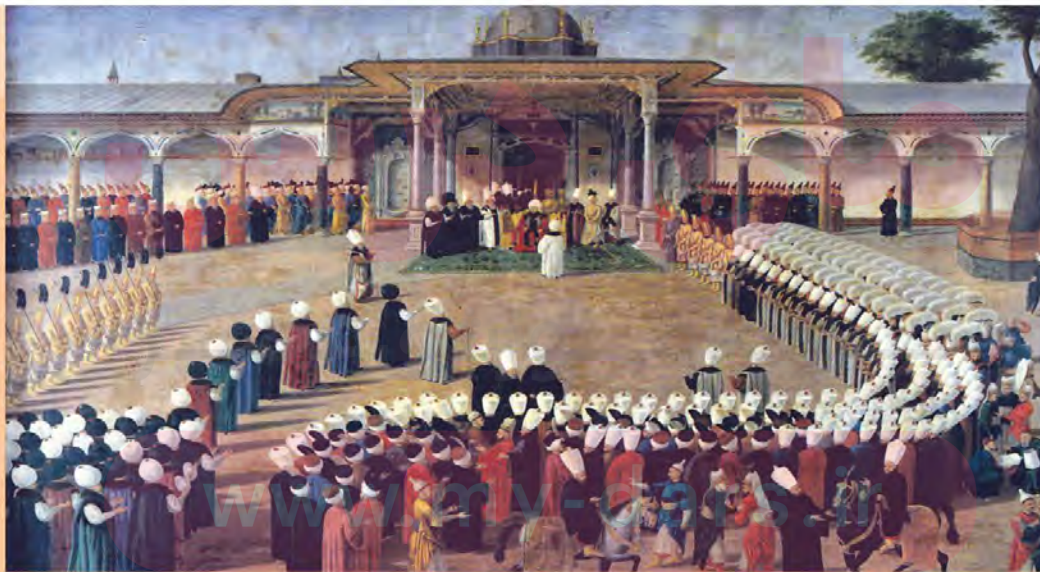
نگاره سلطان سلیم سوم (۱۷۸۹-۱۸۰۷ م) هنگام به حضور پذیرفتن مقام‌های امپراتوری در کاخ توپ‌کاپی - استانبول

2) سده‌های هفدهم تا نوزدهم میلادی دو سوی عالم وضعیت دوگانه متضادی داشت؛ در جانب شرق سه حکومت مسلمان یعنی ایران، عثمانی و گورکانیان هند دوران ضعف خود را سپری می‌کردند و در جانب غرب، امپراتوری‌ها و دولت‌های روسیه، فرانسه و انگلستان در مسیر قدرت و شکوفایی قرار داشتند (2). ضعف امپراتوری‌های مسلمان دلایل خاص خود را داشت. علل ضعف دولت‌های اسلامی به‌ویژه ایران، هند و عثمانی در قرون اخیر، از مهم‌ترین مسائلی است که همچنان بررسی‌ها درباره آن ادامه دارد. در این بررسی‌ها، چگونگی عملکرد و نقش استعمار غربی و همچنین کانون‌های داخلی وابسته به آن در بروز و تشدید عقب ماندگی دولت‌های بزرگ اسلامی، از اهمیت بیشتری برخوردار است.