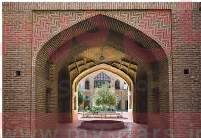
مدرسه علمیة خان یزد؛ این مدرسه به همت محمدتقی خان، والی خیراندیش یزد در سال ۱۱۸۶ ق بنا شد.

شعر و ادب فارسی در دوره زندیه تحول چشمگیری یافت که محققان از آن با عنوان «نهضت بازگشت ادبی» یاد کرده اند. چهره های برجسته این سبک ادبی به سبک خراسانی و شیوه شعری چون فرخی، عنصری، سعدی و حافظ شعر می سرودند.