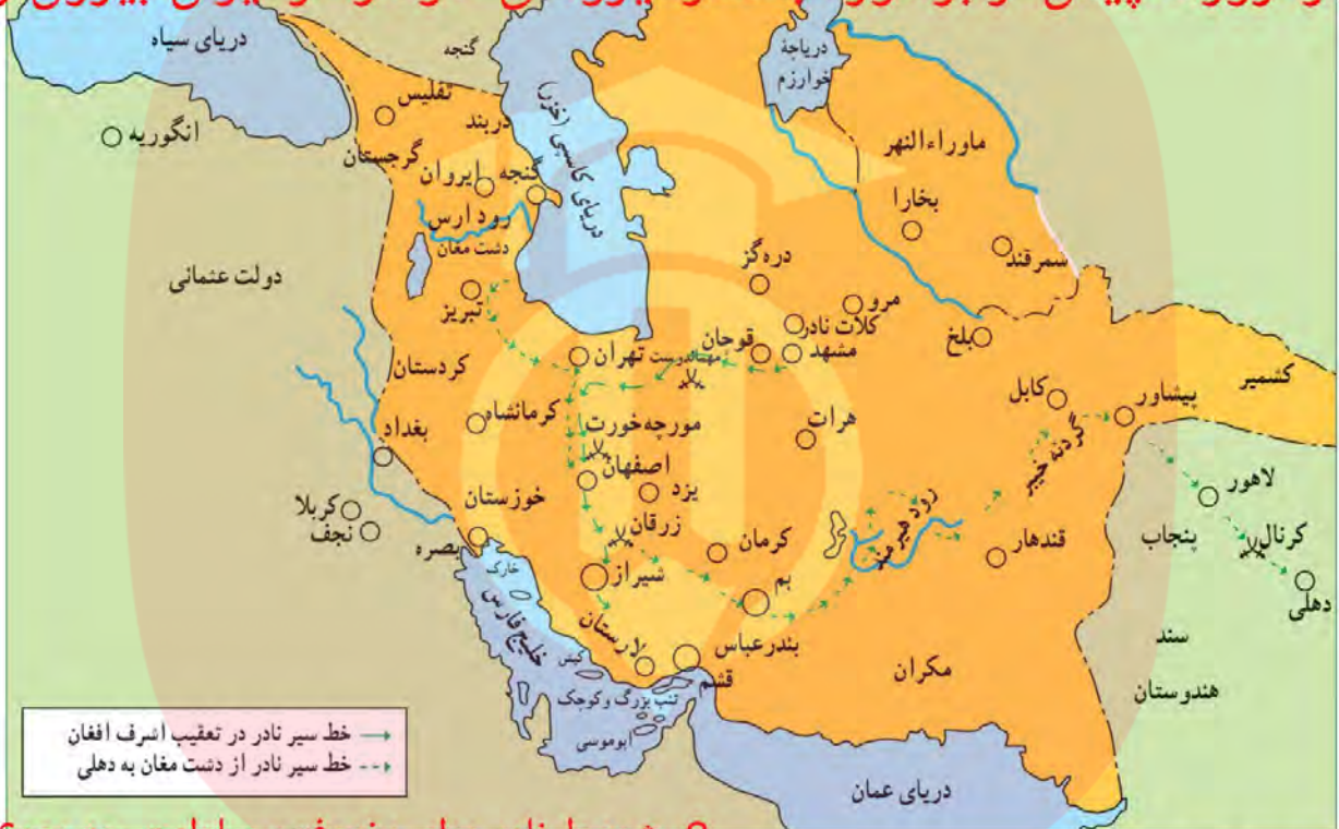
نقشه لشکرکشی‌ها و جنگ‌های نادر