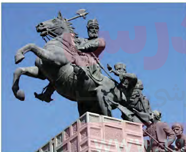
مجسمه نادرشاه افشار - باغ نادری - مشهد