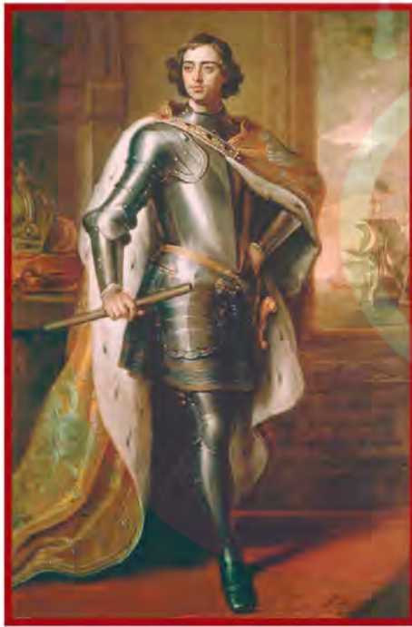
پتر کبیر، پدر روسیه جدید

۵- روسیه در مسیر توسعه طلبی نظامی؛ روسیه تا پیش از به قدرت رسیدن پتر کبیر (۱۶۸۲-۱۷۲۵م) در رقابت استعماری اروپاییان جایگاهی نداشت. اما سیاست و اقدام های پتر کبیر، این کشور را متحول کرد و در مسیر توسعه طلبی سیاسی و نظامی قرار داد. (و با استخدام کارشناسان اروپایی، تأسیس مدارس و دانشگاه های جدید و تقویت ارتش به ویژه نیروی دریایی، این کشور را وارد مسابقه استعمار کرد) (یکی از برنامه های پتر برای قدرتمند شدن روسیه، گسترش سرزمین روسیه و دستیابی به دریاهای آزاد برای کسب منافع تجاری و سیاسی بود). جانشینان او تلاش کردند به این برنامه عمل کنند و به همین سبب در نواحی شرقی اروپا و حوزه دریاهای بالتیک، سیاه و مازندران (خزر) اقدامات نظامی وسیعی انجام دادند. این اقدامات موجب جنگ های متعدد روسیه با ایران، عثمانی و برخی کشورهای اروپایی، نظیر فرانسه شد.