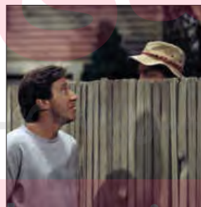
■ بررسی پدیده های خرد و کلان در جامعه شناسی شهری؛ روابط همسایگی، ریخت شناسی شهری، ترافیک، آلودگی و مهاجرت.

۱- با مفهوم ساختار اجتماعی در درس بعد آشنا می شوید.