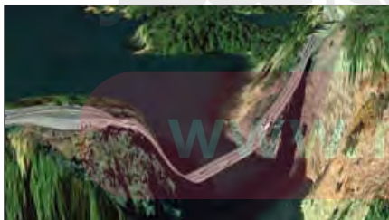
پلی در جزیره کانتی واشنگتن

ما حتی اگر درباره علوم طبیعی اطلاعات چندانی نداشته باشیم، می‌پذیریم که این علوم خوب هستند و نتایج سودمندی دارند.