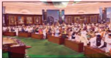
■ پارلمان هند