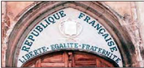
■ شعار جمهوری فرانسه بر سر در یک کلیسا پس از قانون سال ۱۹۰۵ م مبنی بر جدایی دین از سیاست.