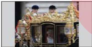
■ مشروطه سلطنتی انگلستان