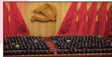
■ حزب کمونیست چین