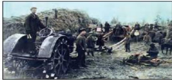
■ با تشکیل اتحاد جماهیر شوروی، مزرعه‌داری دولتی و مزرعه‌داری اشتراکی به عنوان دو شیوه پیشبرد اقتصاد کشاورزی، رایج شدند.