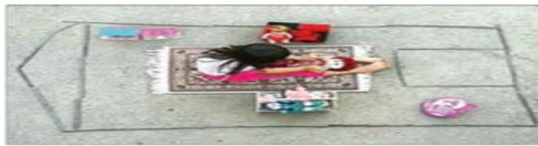
جامعه پذیری رسمی و غیررسمی