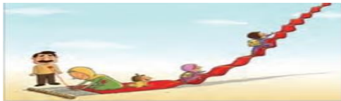
خانواده، مدرسه، مسجد و رسانه‌های جمعی از عوامل آشنایی افراد با جامعه هستند.