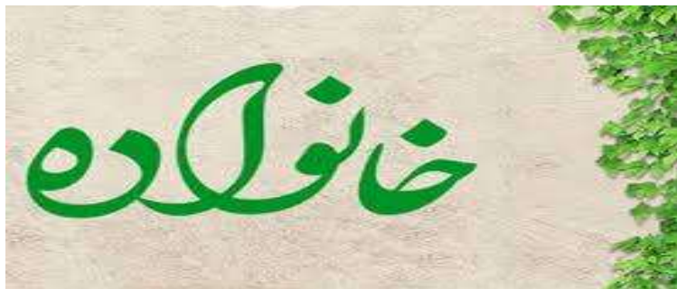
متن پیشنهادی از گروه آموزشی علوم اجتماعی استان یزد