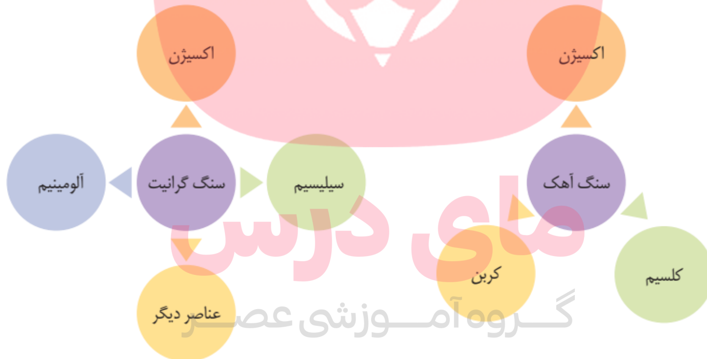
شکل ۲-۵- عناصر تشکیل دهنده گرانیت و سنگ آهک

علم ژئوشیمی در بررسی ترکیب شیمیایی سنگ ها، خاک و آب به ما کمک می کند. مطالعات ژئوشیمیایی نشان می دهد که توزیع عناصر در زمین و ترکیب سنگ ها در مناطق مختلف، متفاوت است.