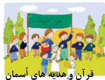
قرآن و هدیه های آسمان

خیر دنیا و آخرت با دانش است و شر دنیا و آخرت با نادانی . پیامبر اکرم ( ص )