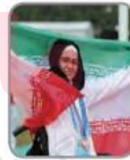
اللاعِبَةُ رَفَعَتْ عَلَمَ إِيرَانَ.