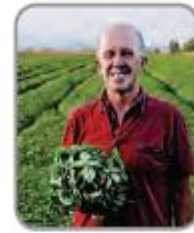
الْفَلَّاحُ زَرَعَ الرَّيْحَانَ.