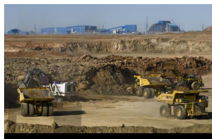
الف) شناسایی معدن و استخراج سنگ آهن

۳. چه مراحل برای تهیه آهن از سنگ معدن باید انجام گردد؟ الف) شناسایی معدن و بیرون آوردن سنگ معدن از دل زمین و انتقال آن به کارخانه - ب) خالص سازی سنگ معدن - پ) گرما دادن مخلوط سنگ آهنک، کربن و آهنک در کوره - ت) تولید ورقه های فلز آهن