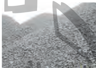
ب) خالص سازی سنگ معدن آهن