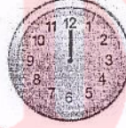
الحادية عشرة تماماً