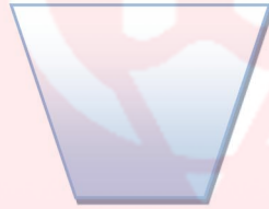
زباله ی تر