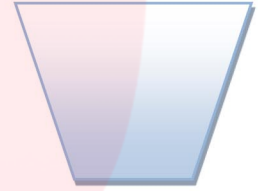
زباله ی خشک