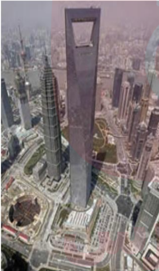
مركز تجارت ملی - شانگهای - چین

بخش خدمات، فعالیت‌های متنوعی را در بر می‌گیرد و گسترش فعالیت‌های خدماتی بر چشم‌انداز و منظره شهرها تأثیرات بسیاری می‌گذارد. مؤسسات و نهادهای مالی، بانک‌ها، مؤسسات گردشگری و مجتمع‌های رفاهی، مؤسسات حمل و نقل، مراکز درمانی-آموزشی و... موجب پیدایش ساختمان‌های بلندمرتبه و برج‌های عظیم در شهرها شده‌اند. مراکز خرید و مجتمع‌های تجاری چندطبقه که هم بخش خرید و هم بخش‌های تفریحی دارند، در بسیاری از شهرهای بزرگ جهان گسترش یافته‌اند. این مراکز معمولاً طراحی و معماری مشابهی دارند.