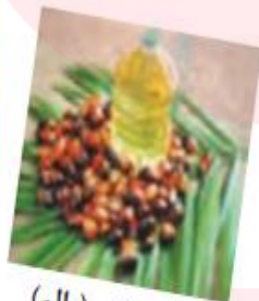
نخل روغنی (پالم)