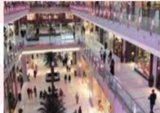
مركز خرید - دوبي - امارات متحده عربي