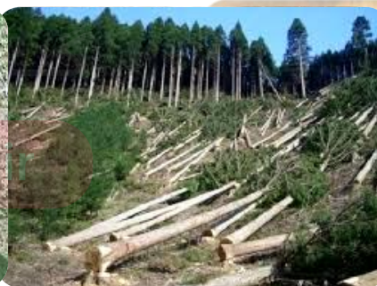
صفوی فارس، جهرم