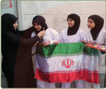
نَحْنُ وَقَفْنَا لِأَخْذِ الْجَوَائِزِ. ما برای گرفتن جایزه ها ایستادیم