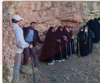
نَحْنُ عَبَرْنَا الْجَبَلَ.