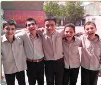
نَحْنُ فَرَحْنَا كَثِيرًا. ما بسیار خوشحال شدیم