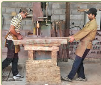
نَحْنُ قَطَعْنَا الْخَشَبَ. ما چوبها را بریدیم