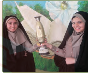
نَحْنُ شَعَرْنَا بِالِافْتِخَارِ. ما احساس افتخار کردیم