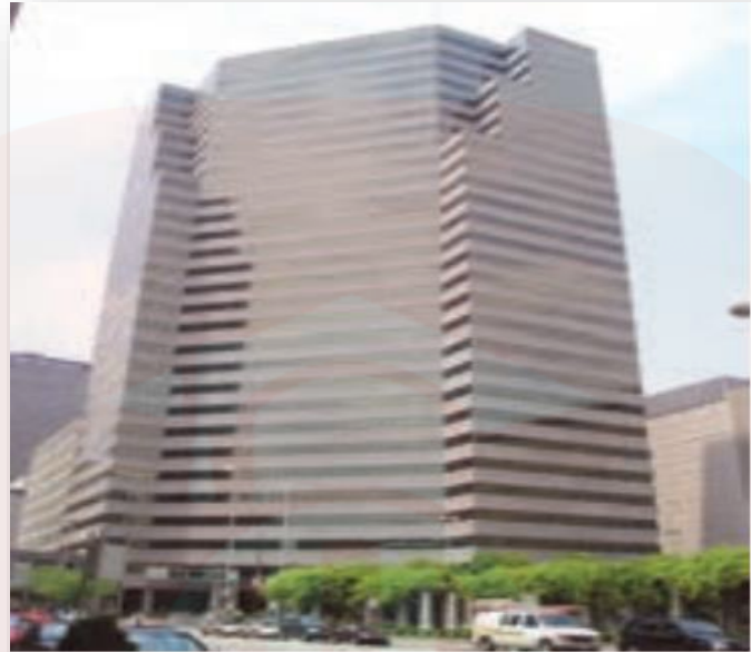
دفتر مرکزی یک شرکت چند ملیتی تولید موز - اوهایو