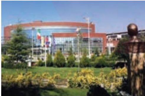
پارک فناوری پردیس - تهران

در این پارک ها از تحقیقات دانشگاهی استفاده می کنند. در این مناطق، آزمایشگاه های متعدد تحقیقاتی و پژوهشگرانی که به ابداع و نوآوری مشغول اند، تمرکز یافته اند.