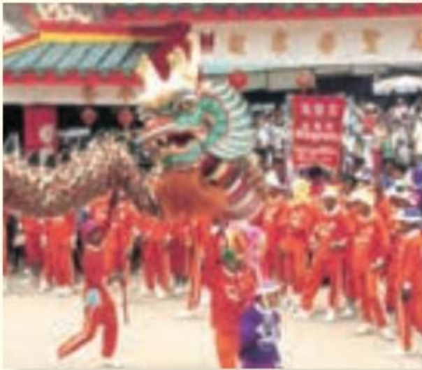
جشن سال نو - چین