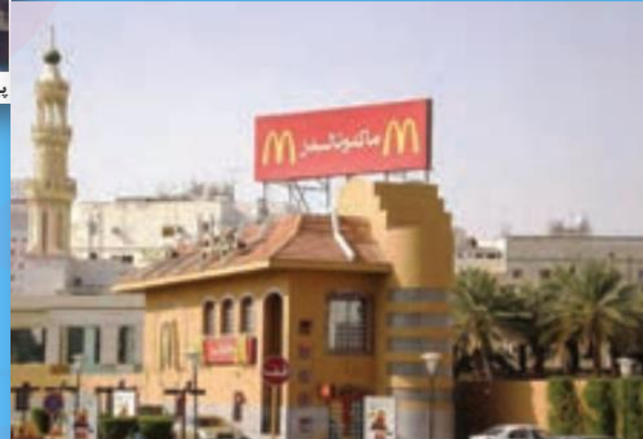
شعبه یک فست فود امریکایی - عربستان