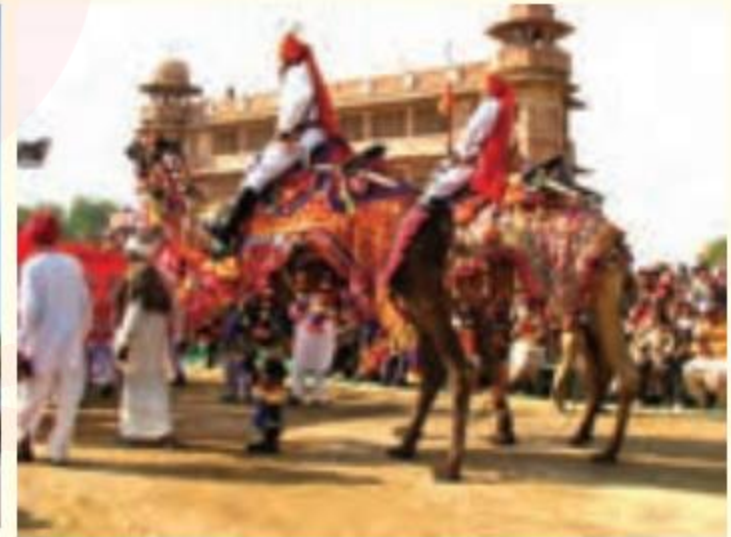
جشن شتر - ایالت راجستان هند