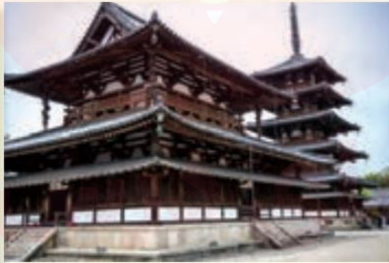
معماری سنتی - ژاپن