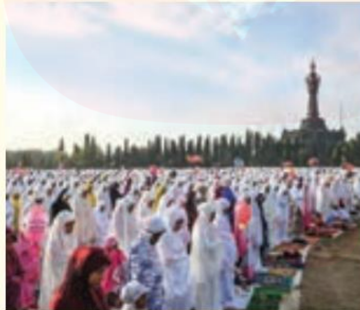
برگزاری نماز عید فطر - اندونزی