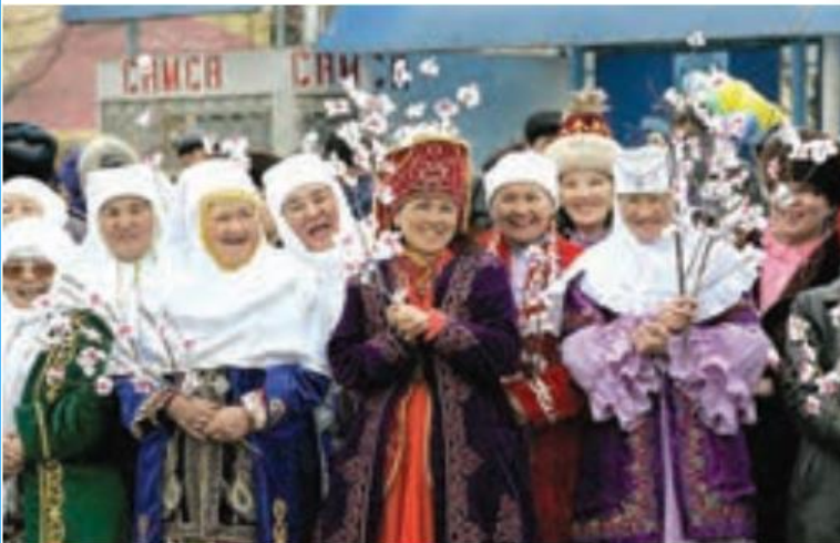
جشن نوروز - روستایی در قزاقستان