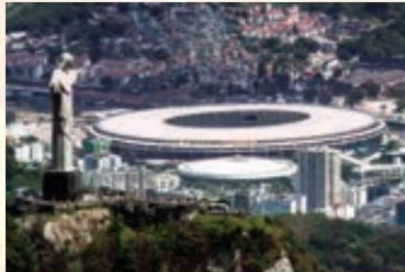
استادیوم ماراکانا و مجسمه حضرت عیسی (ع) ریودوژانیرو - برزیل