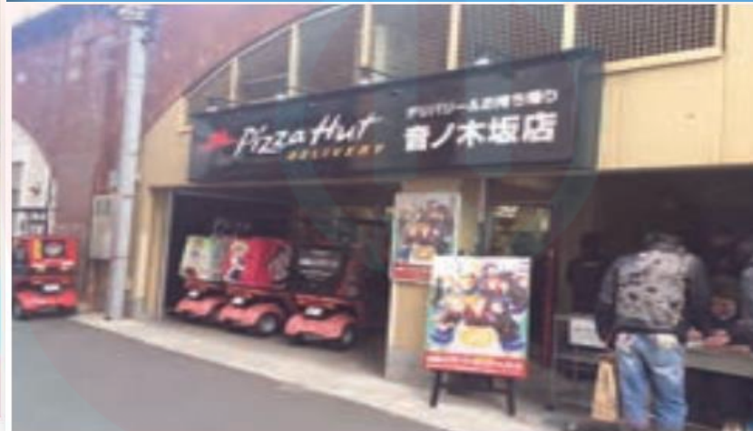
پیتزا فروشی - ژاپن