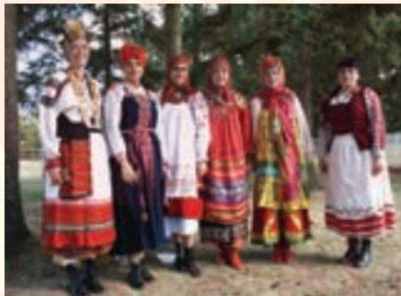
مراسم جشن - اسلاوها