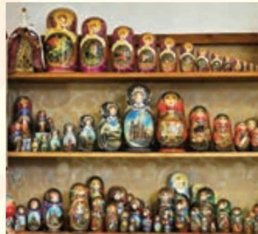
عروسک‌های چوبی (ماتروشکا) - صنایع دستی روسیه