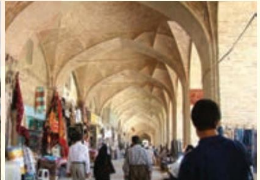
بازار کرمان - ایران