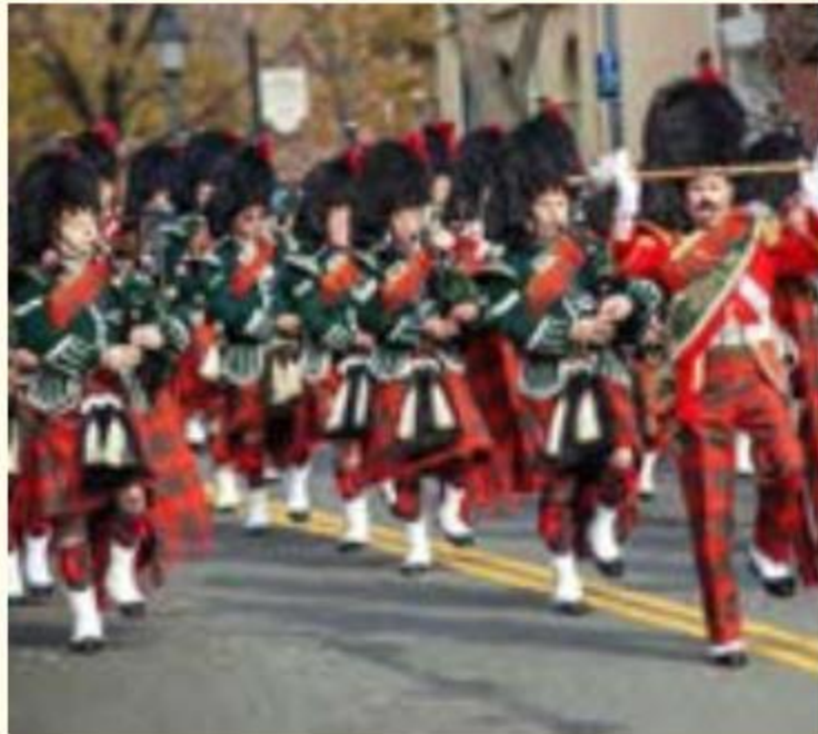
رژهٔ اسکاتلندی‌ها در جشن ملی