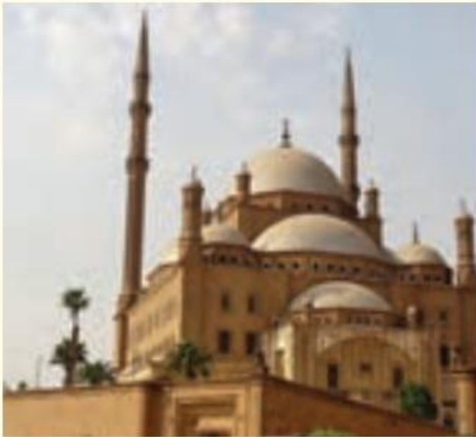
مسجد محمد علی پاشا - قاهره