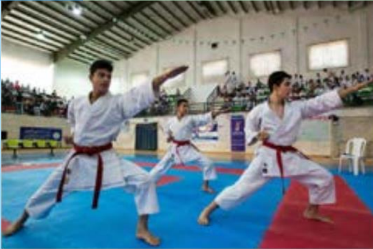
ورزش کاراته - ایران

به تصاویر توجه کنید؛ در هر تصویر چه پدیده ای را مشاهده می کنید؟ به نظر شما خاستگاه این پدیده ها کجاست و چگونه به این ناحیه هامنقل شده اند؟