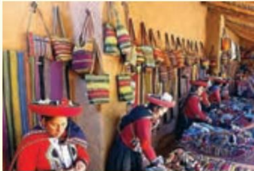
فروشگاه صنایع دستی - پرو

مذهب کاتولیک، که با مذاهب بومی و قبیله‌ای آمیخته شده، و همچنین زبان‌های دو کشور استعمارگر ..... و ..... در این ناحیه رواج دارد. به‌طور کلی، اقتصاد و فرهنگ این ناحیه، مشابه اروپای مدیترانه‌ای است.