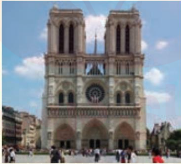
کلیسای تاریخی نوتردام - پاریس، فرانسه