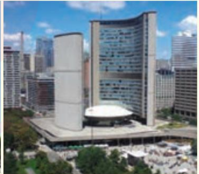
معماری مدرن - کانادا