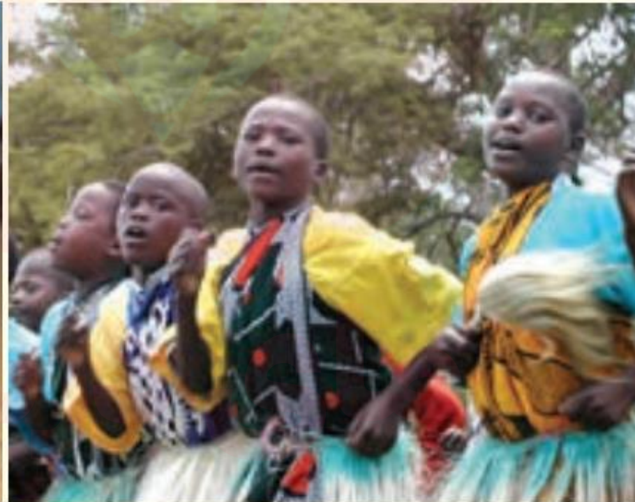
اجرای سرود - دانش آموزان افریقایی