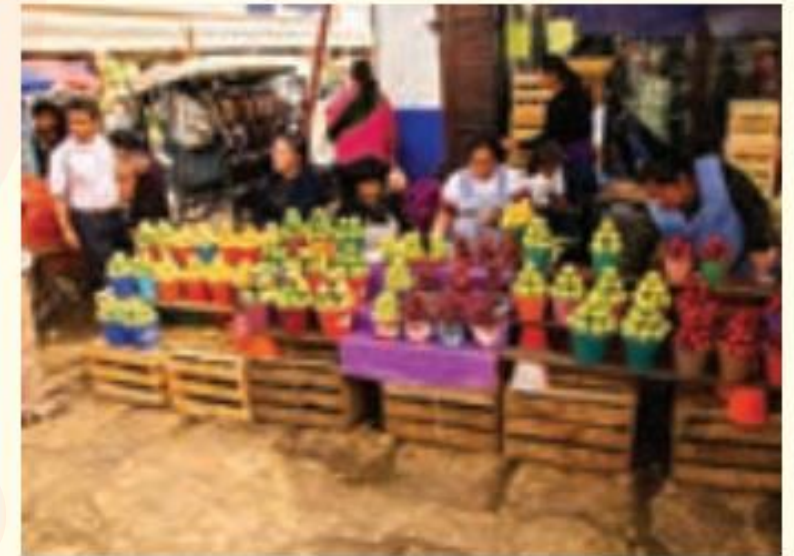
فروش میوه در خیابان - مکزیک