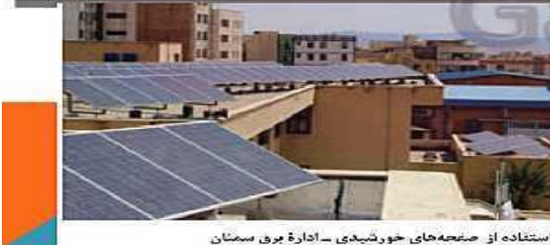
استفاده از پنل‌های خورشیدی - اداره برق سمنان