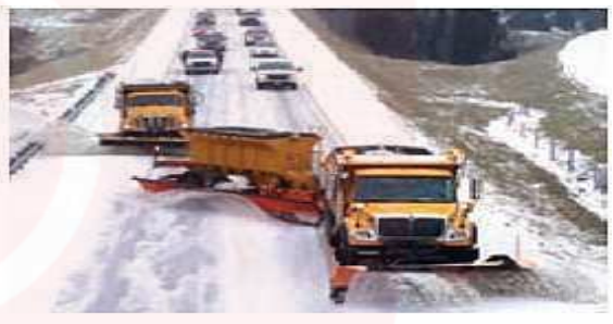
پد کارگیری ماشین برفروب مجهز بد چینی برای اس جادهای برای یاک سازی جادهها - کانادا