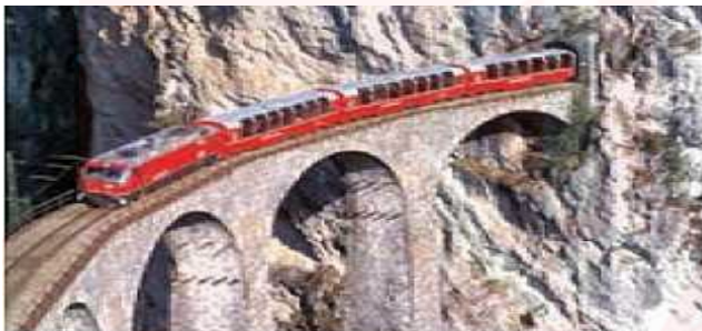
احداث تونل و پل برای عبور قطار در ناحیه های کوهستانی و برف گیر - سوئیس

برای مثال راه آهن در کشوری که نواحی کوهستانی و مرتفع دارد دشوارتر و پرهزینه تر از کشوری که بیشتر زمین های آن پست و جلگه ای هستند.