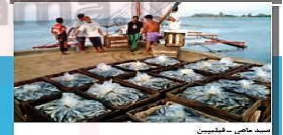
صید ماهی - فیلیپین