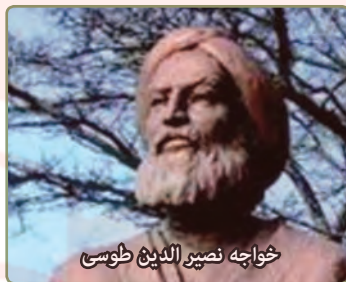
خواجه نصیر الدین طوسی

هِيَ وَصَلَتْ إِلَى بَيْتِهَا. او... به خانه اش رسید.