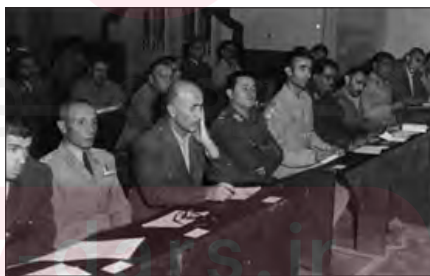
■ دادگاه سران حزب توده، این حزب از سازمان یافته‌ترین گروه‌های سیاسی چپ و مخالف شاه بود که با سرکوب گسترده از سوی حکومت پهلوی روبه رو شد.