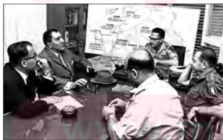
■ دیدار ارتشبد طوفانیان معاون وزیر جنگ حکومت پهلوی با موشه‌دایان وزیر اسرائیل، برای همکاری مشترک نظامی

پس از گذشت بیش از هفتاد سال از انقلاب مشروطه و نیم قرن از حاکمیت پهلوی، انقلاب اسلامی ایران رخ داد. امام خمینی علیه السلام ، انقلاب را هنگامی آغاز کرد که شاه تحت حمایت دولت‌های غربی بود و مأموریت حفظ امنیت منطقه را به عهده داشت. روشنفکران چپ نیز از صحنه رقابت‌های سیاسی داخلی کشور حذف شده بودند.