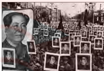
■ انقلاب‌های کوبا، الجزایر، هند و چین