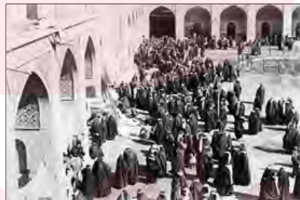
■ حضور فعال مردم در جنبش تنباکو به تبعیت از علما ■ نمایندگان دوره‌های نخست مجلس شورای ملی

برخورد رقابت‌آمیز عالمان دینی با قاجار، حرکتی اصلاحی بود. آنها برای اصلاح برخی رفتارهای