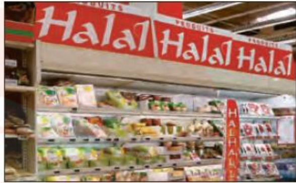
■ گسترش اسلام در کشورهای غربی