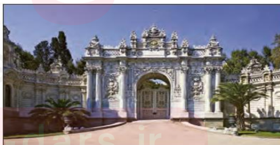
■ کاخ دلمه باغچه در استانبول، در بنای این کاخ که محل اقامت آخرین سلاطین عثمانی بوده، ۱۴ تن ورقه طلا به کار رفته است.