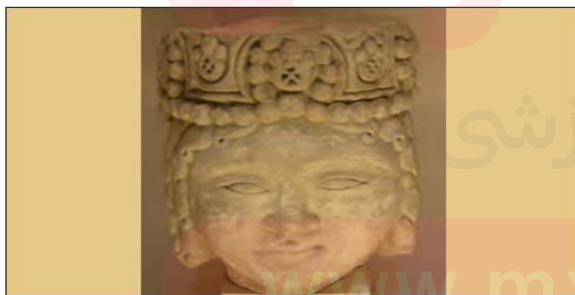
■ سردیس شاهزاده سلجوقی، مهم ترین پوشش سر پادشاهان سلجوقی و غزنوی تاج با تزییناتی از جواهرات بود.