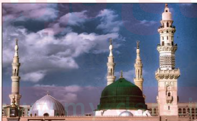
■ مسجد النبی در مدینه