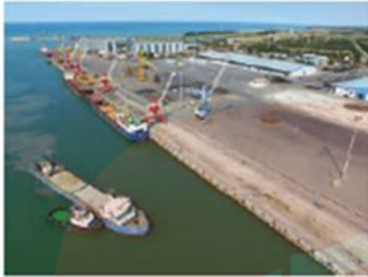
بنادر امیرآباد - اصفهان مزاندوران