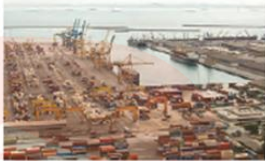
بنادر شهید رجایی - مهم‌ترین بندر کانتینری ایران