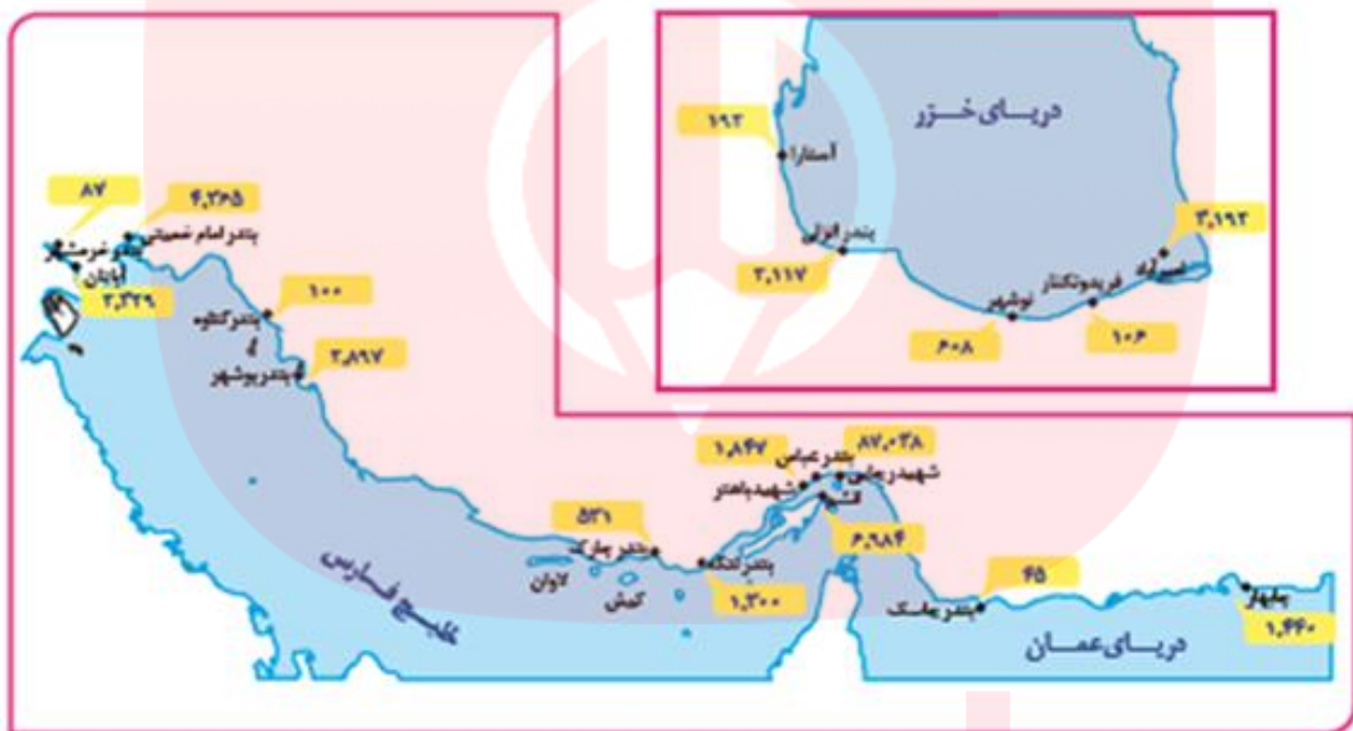
میزان تخلیه و بارگیری ۷۴ در بندر فعال تحت نظارت سازمان بندر و دریانوردی ۱۳۹۶ (واحد: هزار تن)