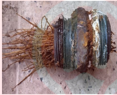
نفوذ تارهای کشنده درخت درون لوله آب