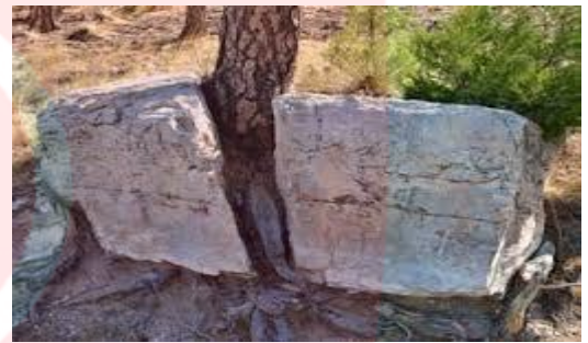
دو نیم شدن سنگ بر اثر رشد ریشه درخت