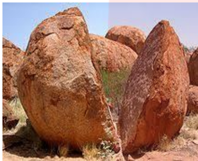
دو نیم شدن سنگ بر اثر انجماد آب

۲- نفوذ ریشه گیاهان در سنگها باعث جدا شدن سنگها شده و عمل هوازدگی را سرعت می بخشد. شاید در کنار پیاده روها برآمده شدن آسفالت و سنگ فرش های خیابانها را به علت رشد ریشه درختان دیده باشید.