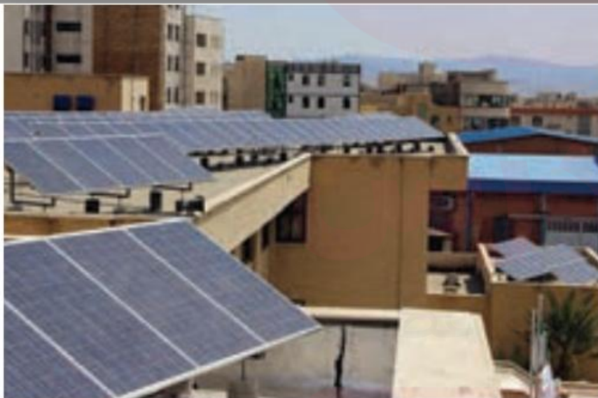
استفاده از صفحه‌های خورشیدی - اداره برق سمنان