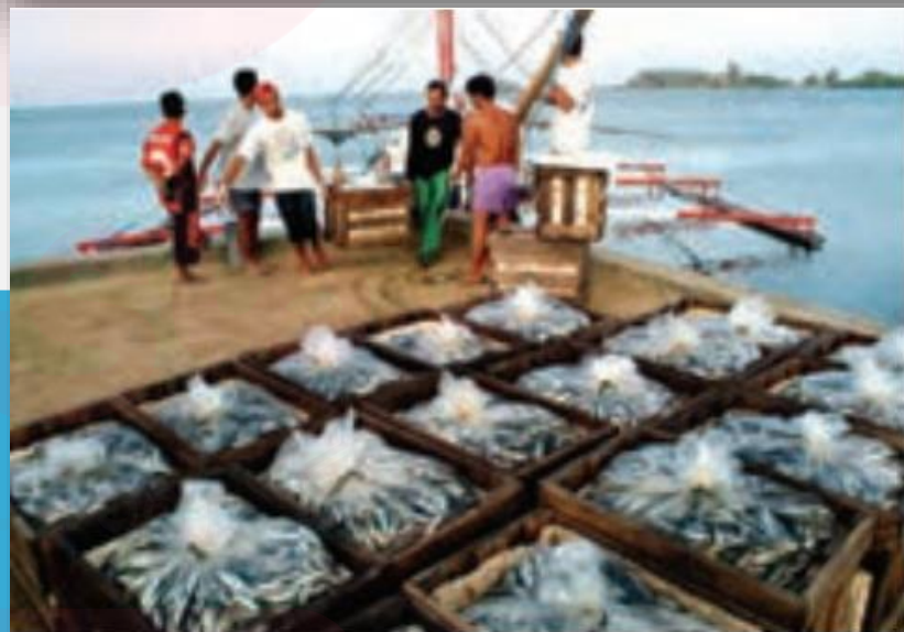
صید ماهی - فیلیپین