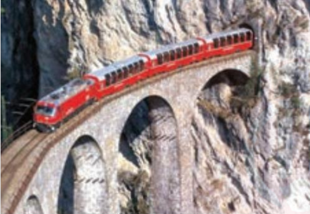
احداث تونل و پل برای عبور قطار در ناحیه‌ای کوهستانی و برف‌گیر - سوئیس