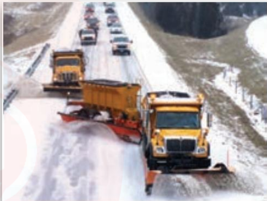
به کارگیری ماشین برف‌روب مجهز به جی‌پی‌اس جاده‌ای برای پاک‌سازی جاده‌ها - کانادا