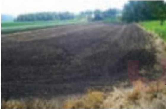
خاک چرنوزوم (خاک حاصلخیز غنی از مواد آلی و ریشه علفزارها)