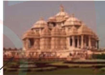
آکشاردام - بزرگ ترین معبد هندوها