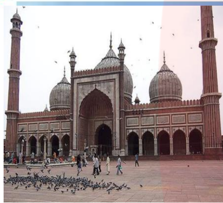
مسجد جامع دهلی، یکی از بزرگ ترین مساجد جهان

در نقشه شماره ۶ کشور هند را می بینید که بر مبنای پراکندگی ادیان ناحیه بندی شده است. هر دین تقریباً قلمرو جغرافیایی خاصی را در سرزمین هند اشغال کرده است.