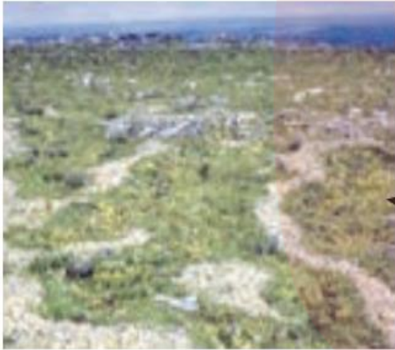
خاک کریوزول (خاک یخ بسته نواحی توندرا)

در نقشه ۲ پراکندگی خاک ها در کانادا را مشاهده می کنید. نوع خاک، ناحیه هایی متمایز از یکدیگر به وجود می آورد و بر نوع پوشش گیاهی و کشت و... نیز اثر می گذارد.