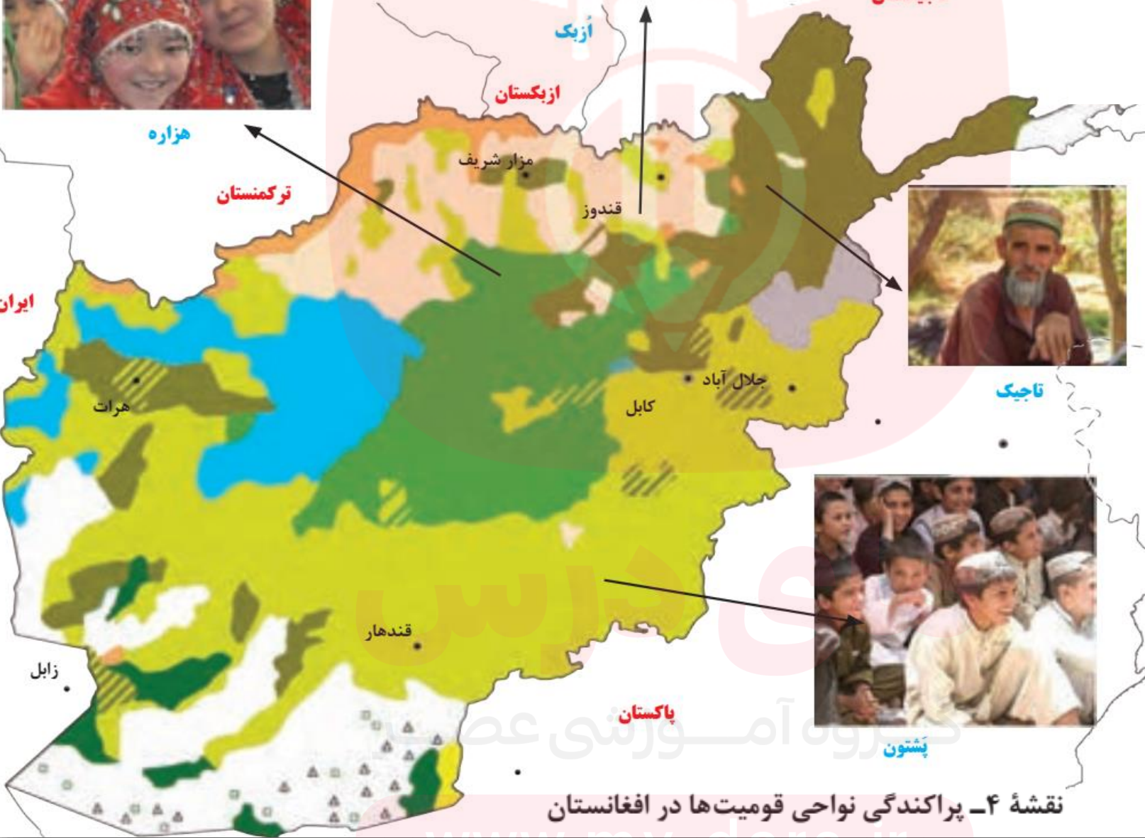
نقشه ۴- پراکندگی نواحی قومیت‌ها در افغانستان