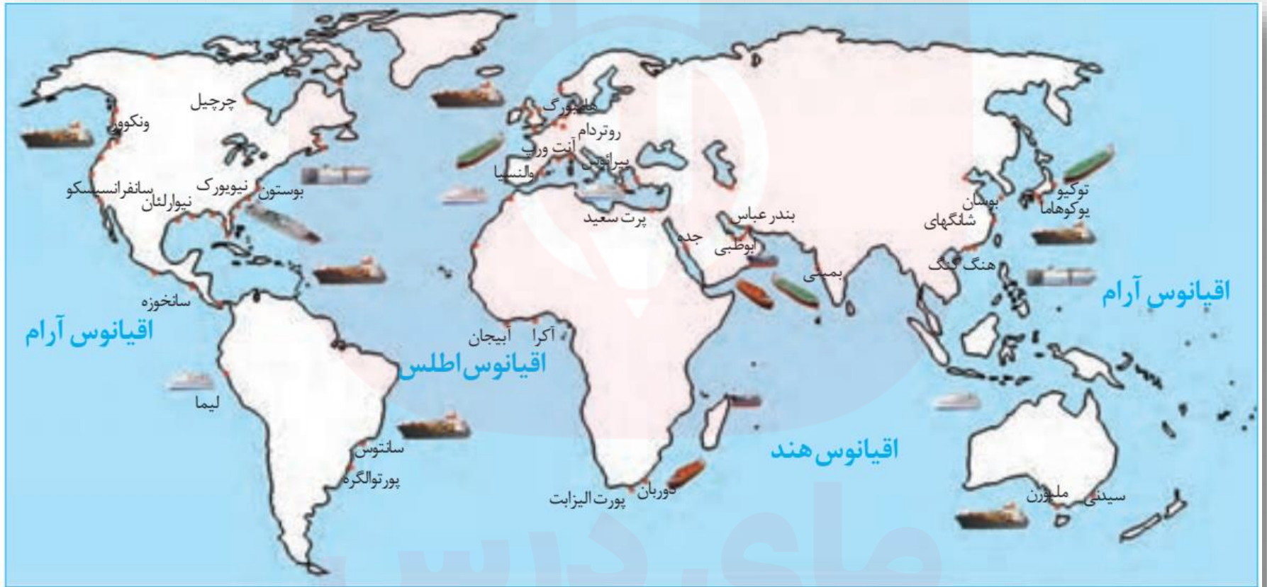
برخی از مهم ترین بنادر جهان