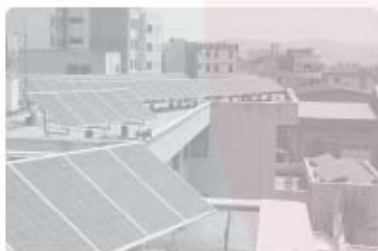
استفاده از صفحه‌های خورشیدی - اداره برق سمنان

از یک سو، انسان‌ها با پیشرفت در تولید ابزار و فناوری و دانش بر محیط طبیعی غلبه می‌کنند و آن را تحت اختیار خود درمی‌آورند؛ از سوی دیگر، ویژگی‌های هر ناحیه طبیعی همواره زندگی مردم ساکن در آن را تحت تأثیر قرار می‌دهد.