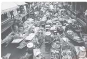
بازار شناور - بانکوک

مثال ۱) بازارهای شناور بانکوک (پایتخت تایلند) که از دیدنی‌های آسیای جنوب شرقی است، در اثر دخالت و دستکاری انسان در محیط ساحلی این ناحیه به وجود آمده است. در این بازارها، دست‌فروشان در قایق‌های چوبی بر روی رودخانه اصلی این شهر، کالاهای خود را برای فروش عرضه می‌کنند. این شیوه خاص فروش کالا، ناحیه تجاری و گردشگری خاصی را برای بازدید گردشگران خارجی ایجاد کرده است.