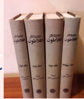
مجموعه آثار افلاطون

۴ (ارسطو نظر استاد خود افلاطون را پذیرفت که قوه نطق و قابلیت حیات مربوط به نفس است، نه بدن. بدن بدون نفس، یک موجود مرده است. از نظر ارسطو نفس انسان در هنگام تولد، حالت بالقوه دارد و هیچ چیز بالفعلی ندارد، نه علم، نه احساس، نه محبت و نه نفرت و نه هیچ چیز دیگر. نفس، به تدریج این امور را کسب می کند و به «فعلیت» می رسد و کامل و کامل تر می شود (مقصود از «ناطق» بودن انسان هم صرفاً سخن گفتن او نیست، بلکه مقصود اصلی، قوه تفکر و تعقل است) انسان با قوه تفکر خود استدلال می کند؛ یعنی از تصدیقات و تصورات خود کمک می گیرد و استدلال را سامان می دهد. گویا در هنگام استدلال، با خود نطق می کند. پس از تنظیم استدلال نیز با سخن گفتن و نطق، محتوای استدلال را به دیگران منتقل می نماید. (۶)