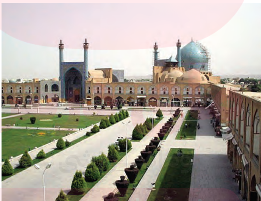
اصفهان، میدان امام

۴ کسی که معتقد است تنها شهود وحیانی قابل اعتبار است.