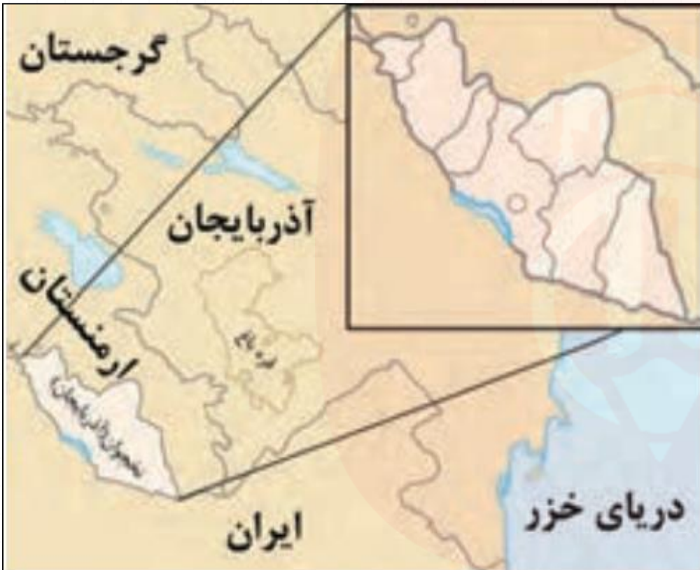
ناحیه سیاسی ویژه - ناحیه خودمختار نخجوان

به عبارت دیگر، خودمختاری، استقلال محدود یک واحد سیاسی در اداره امور خود در داخل یک کشور است.