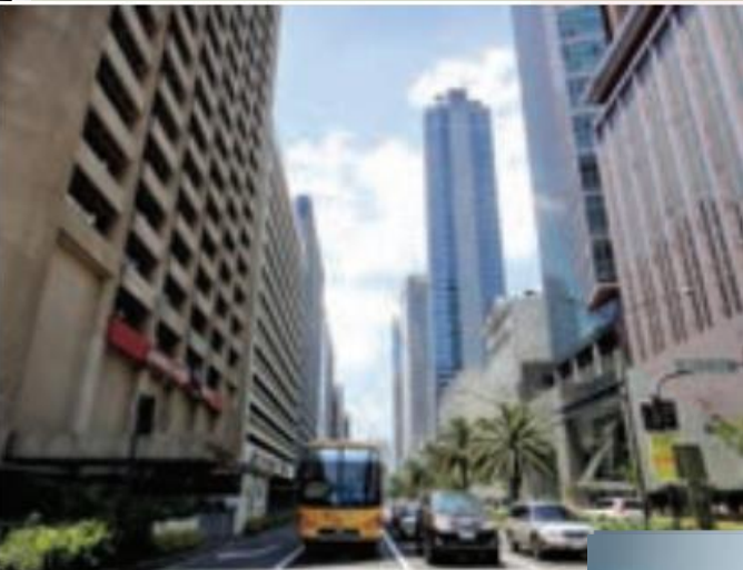
خیابانی در مانیل پایتخت فیلیپین

سیاست ها و تصمیماتی که حکومت یک کشور در زمینه اقتصاد، اشتغال و توزیع در آمد اتخاذ می کند و همچنین نوع برنامه ریزی و بودجه ای که به نواحی مختلف کشور (شهر، روستا، استان و ...) اختصاص می دهد، بر توزیع امکانات و تجهیزات در نواحی مختلف اثر می گذارد. در نتیجه، ممکن است توزیع امکانات مناسب و عادلانه یا به دور از عدالت باشد و چشم اندازها و فضاهای جغرافیایی متفاوتی ایجاد شود.