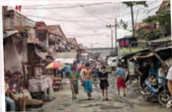
بیش از چهار میلیون نفر از مردم فیلیپین در زاغه‌ها زندگی می‌کنند.