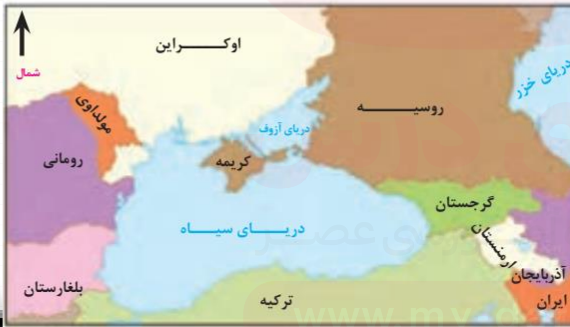
موقعیت جغرافیایی شبه جزیره کریمه

امروزه این شبه جزیره به موضوع کشمکش بین اوکراین و روسیه با مداخله امریکا و دولت های غربی عضو پیمان ناتو تبدیل شده است.