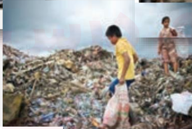
استفاده از کار کودکان در جمع آوری زباله - فیلیپین