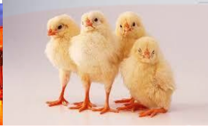
ch - c - en