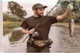
f - s - ing