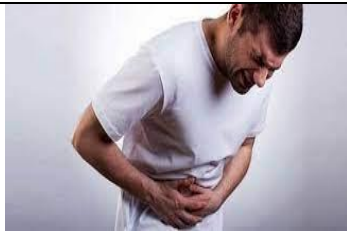
sto m - - ha c - e