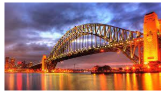
br - d - e