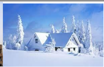
w - nt - r