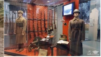
m - s - - m

متن زیر را با استفاده از کلمات داده شده کامل کنید. (یک کلمه اضافه است).