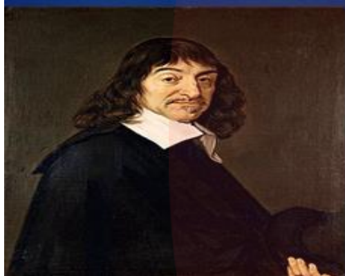
(( رنه دکارت ))

ذهن آزاد است ولی بدن آزاد نیست و تابع قوانین فیزیکی است .